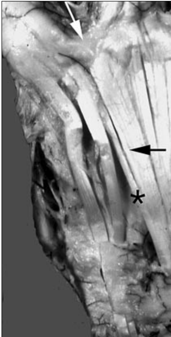
Figura 3. Flecha negra: EDC5. Flecha blanca: división del EDC5 en dos tendones para el EDC4 y EDM. *: tendón accesorio del EDC5 al EDM.