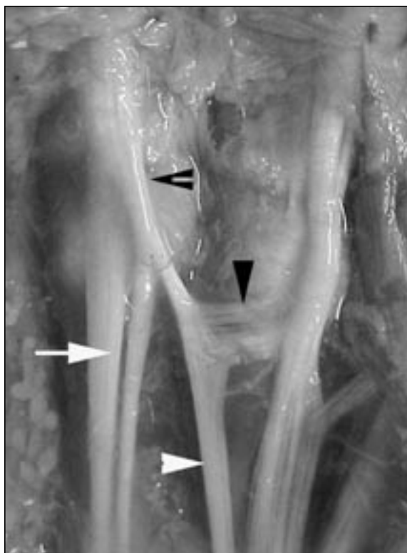
Figura 1. Flecha blanca: EDM. Triángulo blanco: EDC5. Triángulo negro: junta tendínea. Flecha hendida: fusión del EDC5 con el EDM en dorso MCF.