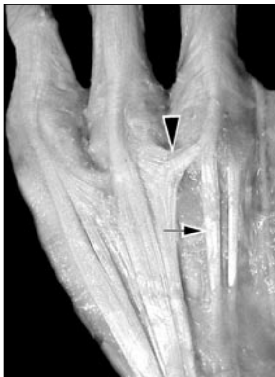
Figura 2. Flecha: EDM. Triángulo: junta tendínea transversal.