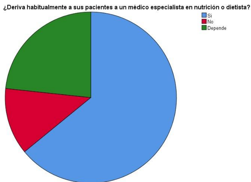
Figura 1: Se evidencia la distribución de los médicos encuestados que derivan habitualmente a sus pacientes.