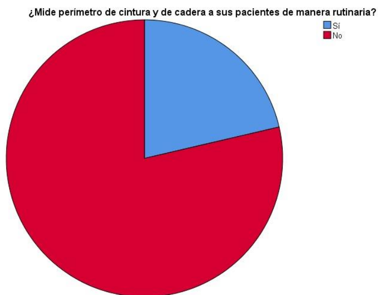
Figura 2: Gráfico tipo torta donde se evidencia que solo 21,4% de los entrevistados mide perímetro de cintura y cadera de manera rutinaria.